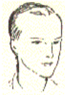
(dessins du Dr Corman)