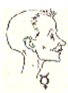
(dessin de Munzinger)